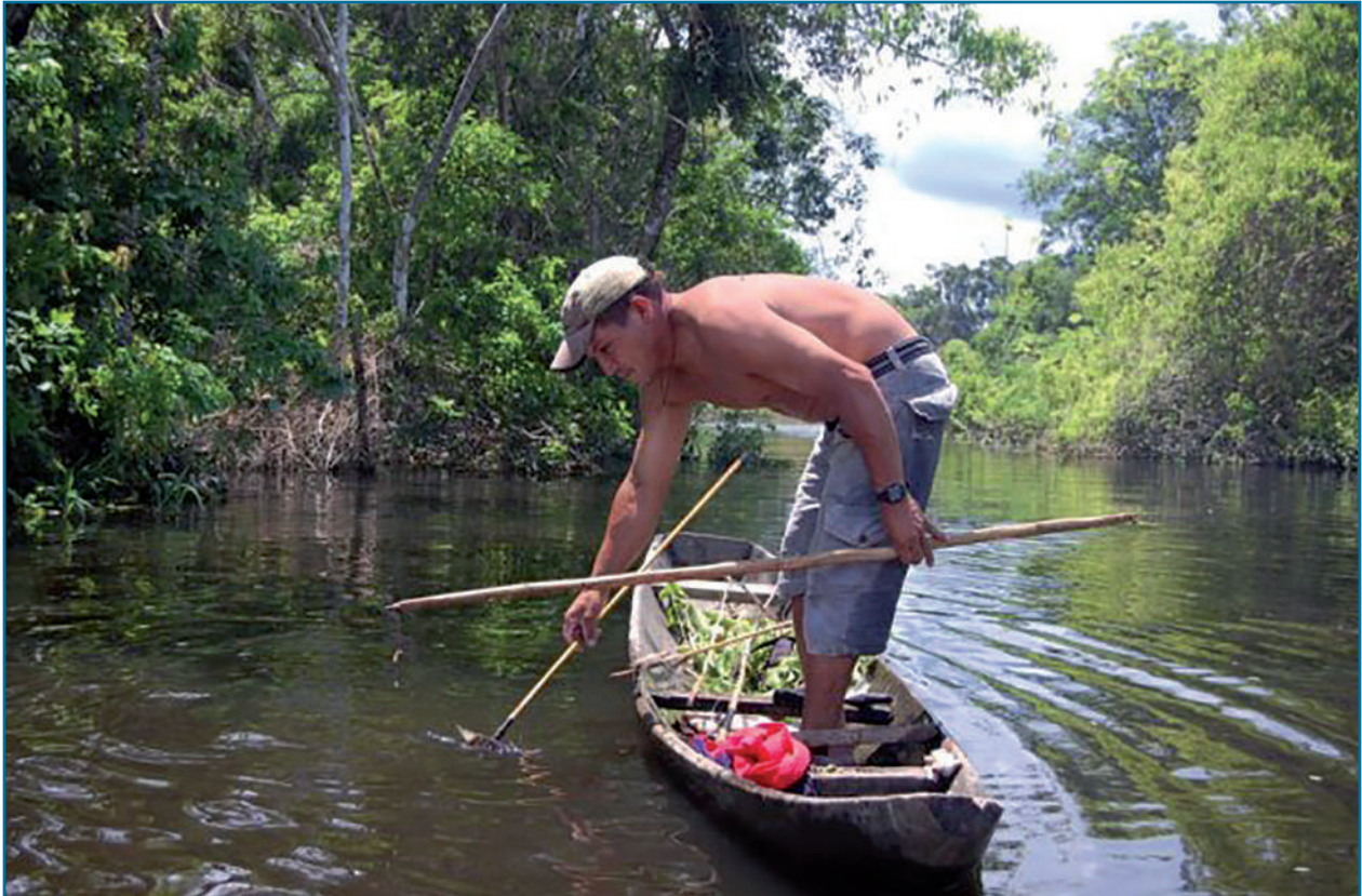
Foto: Sandra Aristizábal. Comunidades locales de la región del Guyana Shield que preservan sus medios de vida tradicionales mientras reciben Pagos por Servicios Ambientales. Imagen tomada en Inírida, Colombia.

gestión conjunta de la Reserva de Vida Silvestre Cuyabeno (Ecuador, 603.380 hectáreas); El Parque Nacional Güeppí-Sekime (242.000 hectáreas); las reservas indígenas Airo Pai y Huimeki (Perú, 592.750 hectáreas) y el Parque Nacional La Paya (Colombia, 422.000 hectáreas) llamado el Programa Cuyabeno-Güeppí Tri-La Paya. Entre 2009 y 2013 se implementaron dos proyectos en coordinación con el plan para apoyar al Programa Trinacional, que recibió fondos de varias organizaciones internacionales. Es de destacar que esta iniciativa superó desafíos a nivel internacional, incluyendo la tensión en las relaciones diplomáticas entre Ecuador y Colombia. Esto se logró, entre otras cosas, por el fuerte compromiso y voluntad de enlazar las autoridades ambientales con el interés común de trabajar de forma coordinada para la conservación de esta región fronteriza.