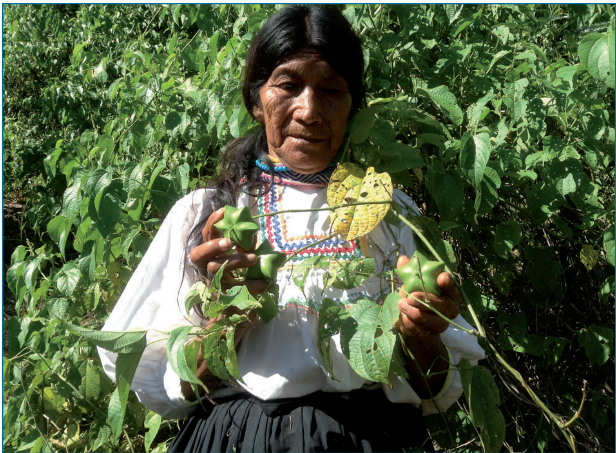
La producción de alimentos orgánica liderada por mujeres promueve la igualdad de género e incrementa la seguridad alimentaria, a la vez que genera ingresos para familias que viven de la agricultura familiar a pequeña escala. Foto de la promoción de un proyecto de agricultura orgánica del Programa de Pequeñas Donaciones en la Región de San Martín, Perú.

La mayoría de los países ya han integrado medidas a su marco de políticas nacionales para hacer frente al cambio climático, haciendo uso de la Convención Marco de las Naciones Unidas sobre el Cambio Climático (UNFCCC, por sus siglas en inglés) y sus compromisos con el Acuerdo de París como marco de referencia. Varios países están llevando a cabo