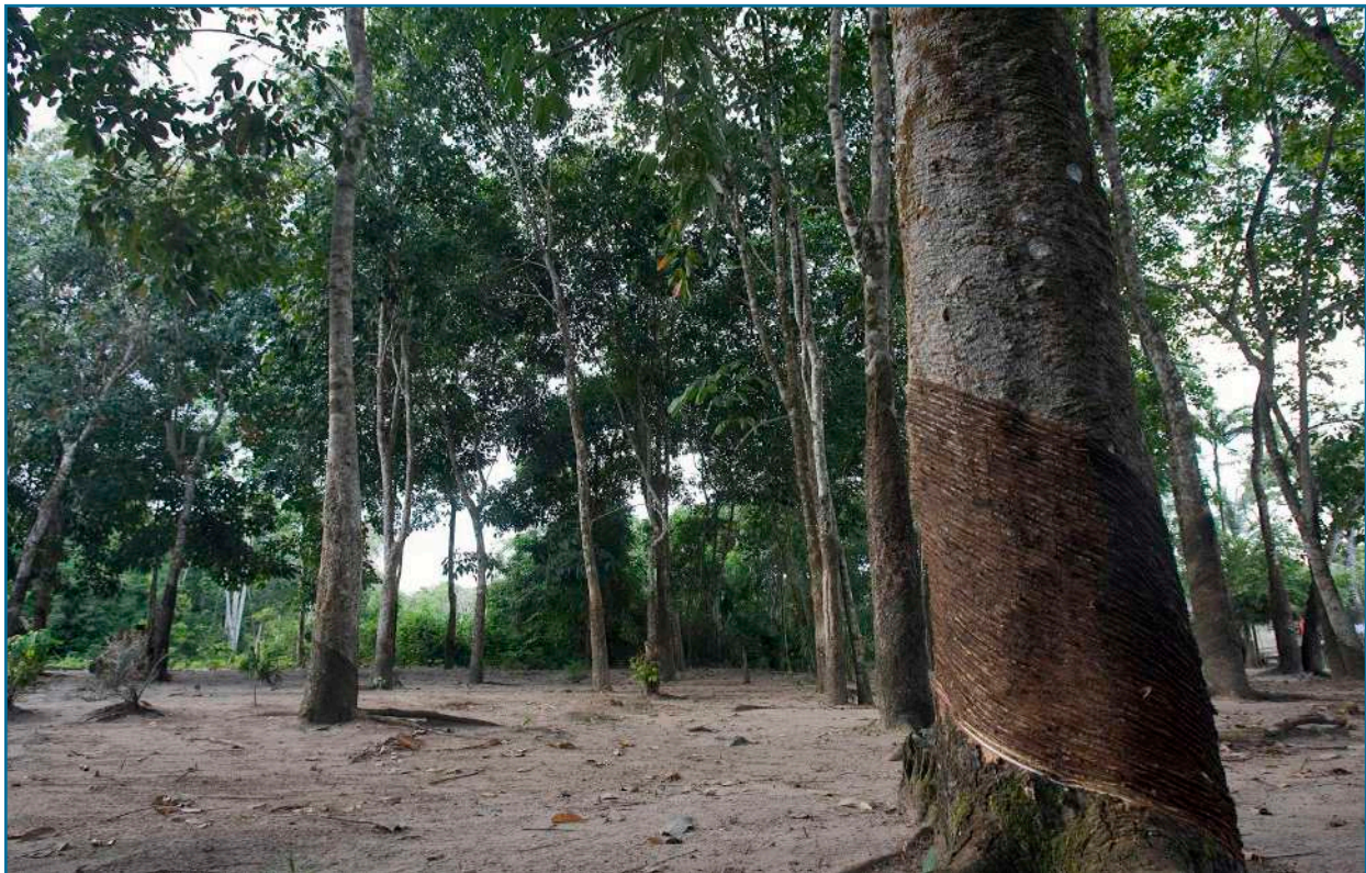
El caucho es un insumo valioso para la producción industrial de látex. Foto del Bosque Nacional Tapajós, en Pará, Brasil.

El estado brasileño de Acre ha estado promocionando industrias sostenibles a través de políticas que han llevado a la creación de varias empresas que protegen el medio ambiente, al tiempo que proporciona a la población local una fuente de ingresos (Furini da Ponte, 2014). En el municipio de