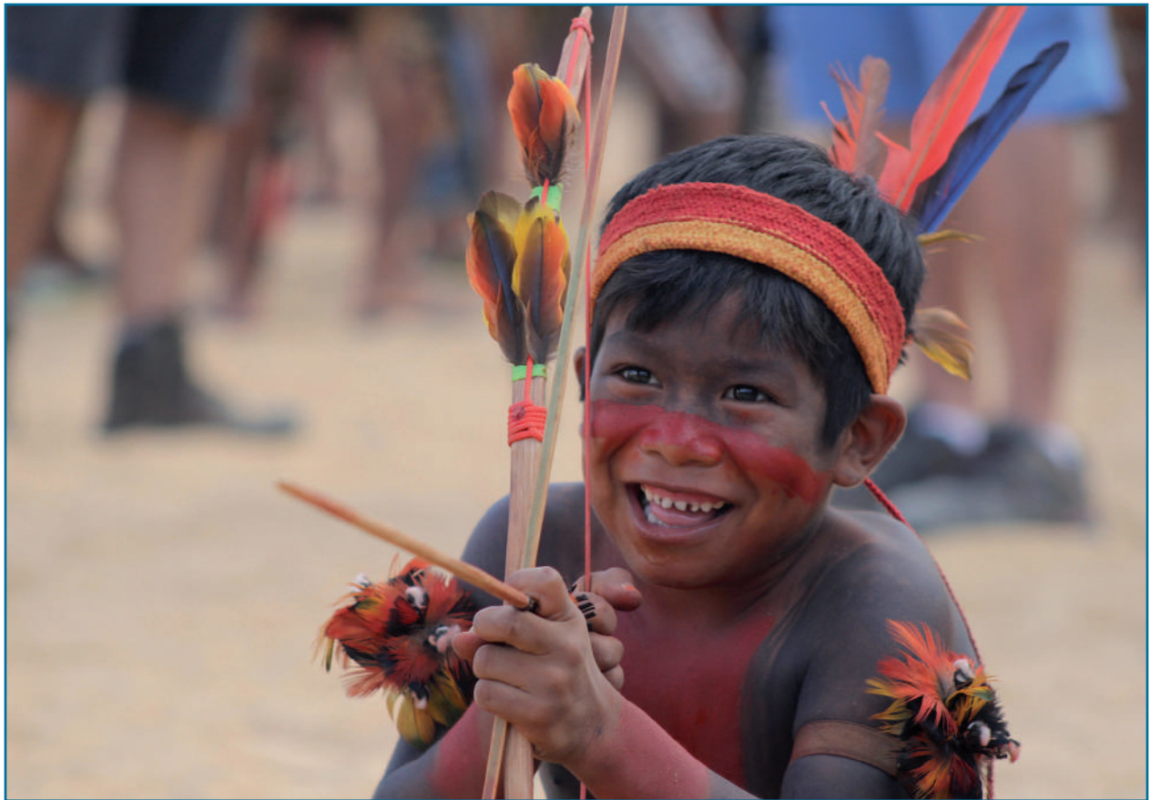
La Amazonía es una región rica y compleja, hogar de varios pueblos, culturas, paisajes, fauna, y flora. Foto de los Juegos Indígenas Mundiales, octubre de 2015.

Este documento proporciona una visión general del contexto de desarrollo en la Amazonía, seguida de una descripción de las características particulares de la región amazónica en relación con los ODS, así como la identificación de los principales desafíos y oportunidades para el desarrollo futuro. Posteriormente, el informe muestra los modelos de transformación exitosos de desarrollo y concluye con un resumen final de las mejores prácticas y lecciones aprendidas con potencial de transformación a escala.