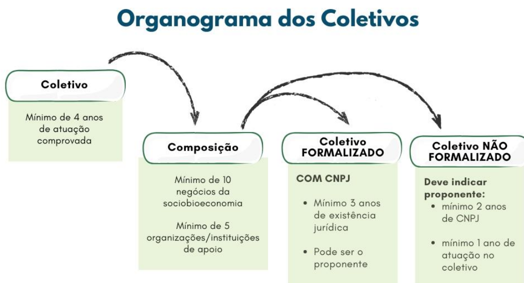
Figura 1. Tipos de coletivos e formas de participação no edital